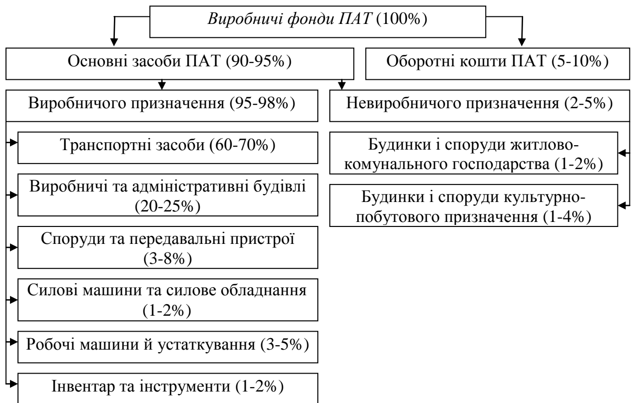
Рисунок 3.3 – Типова виробнича структура основних засобів на підприємствах автомобільного транспорту