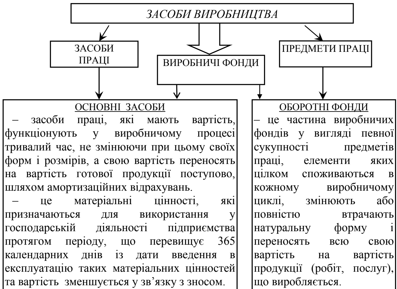
Рисунок 3.1 – Структура виробничих фондів підприємства

У промисловості традиційно використовується наступна видова класифікація основних засобів (рис. 3.2).