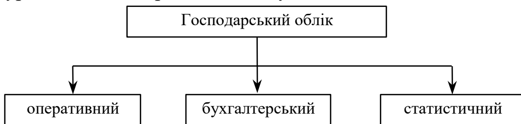
Рис. 1. Структуризація господарського обліку (рахунковедення)

121. Керуючись схемою (рис. 1) дати характеристику структуризації господарського обліку.