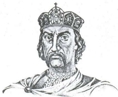
Князь Владимир Великий

1. Конец X (десятого) – первая половина XII (двенадцатого) веков был периодом расцвета Киевской Руси. В X (десятом) веке Киевская Русь стала сильным государством, в котором было много красивых городов.