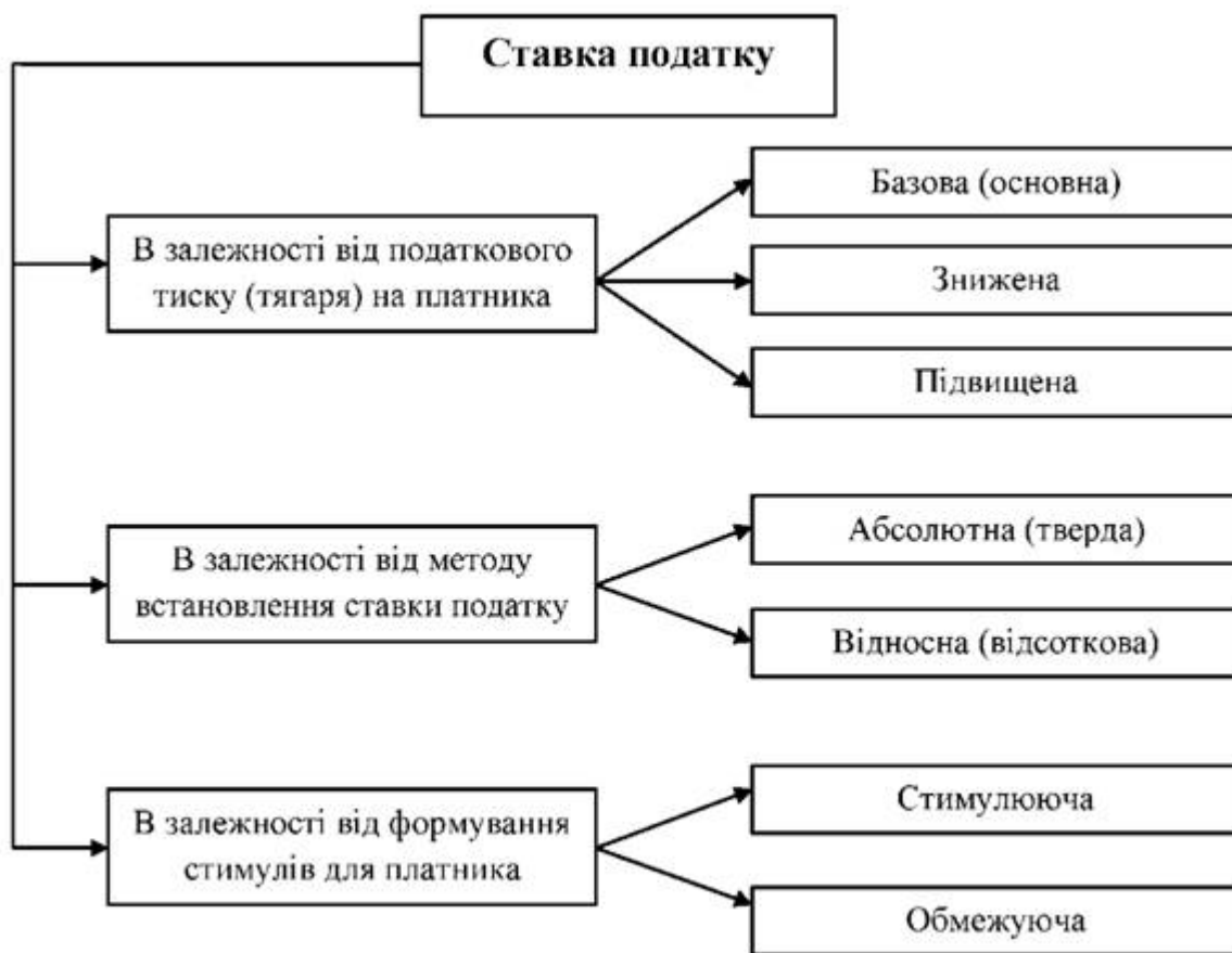
Рис. 4.2. Класифікація податкових ставок

Принципів при класифікації ставок податку може бути декілька. Зупинимося на найбільш важливих (рис. 4.2).