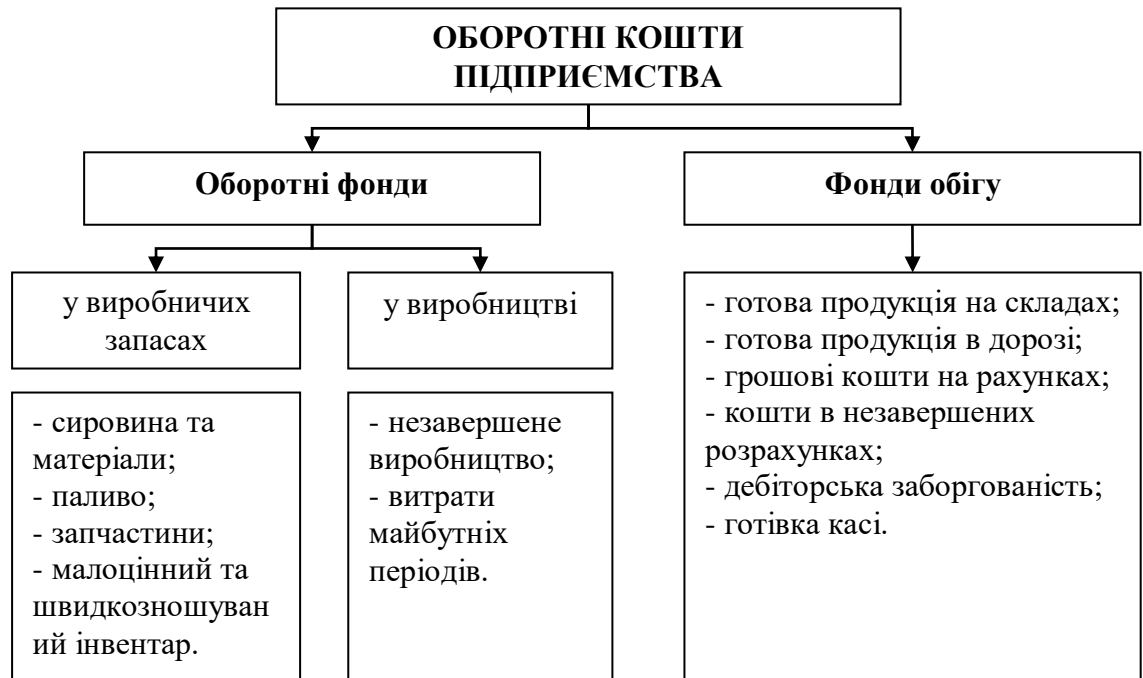
Рисунок 2.1. Склад оборотних коштів підприємства

Розглянемо головні класифікаційні ознаки оборотних коштів підприємства: